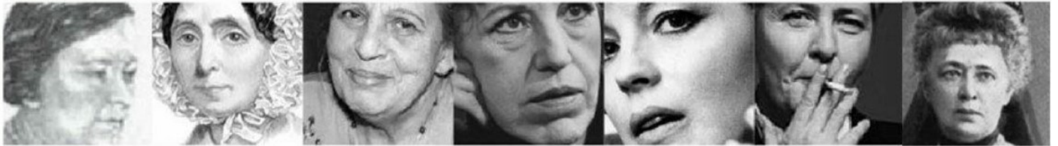
Paula Preradović * Ida Pfeiffer * Ceija Stojka * Lotte Lenya * Romy Schneider * Johanna Dohnal * Bertha von Suttner